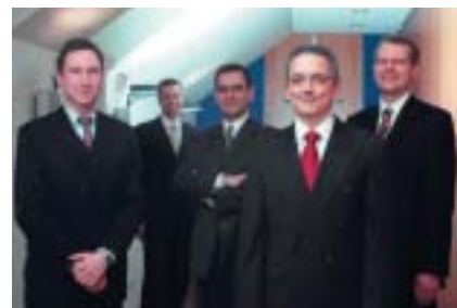
Das Asset Management-Team der LRI Invest.

auf der anderen Seite überdurchschnittliche Ertragschancen zu nutzen, bietet sich der LRI-FondsInvest Global Growth mit einem Aktienfondsanteil von maximal 66 Prozent an. Ein Wechsel innerhalb der drei Depottypen ist ohne Ausgabeaufschlag möglich. Ein Höchstmaß an Flexibilität ist auch dadurch gegeben, dass Kunden über ihre angelegten Mittel oberhalb der festgelegten Mindesteinlagegröße jederzeit verfügen können. Eine unkompliziertere Form der Vermögensverwaltung ist kaum denkbar. Getreu dem Motto: „Gemeinsam mehr erreichen“ bietet die LRI Invest zusammen mit der LRI Landesbank Rheinland-Pfalz International ein wettbewerbsfähiges Produkt, das Vermittlern optimale Ertragschancen verspricht.